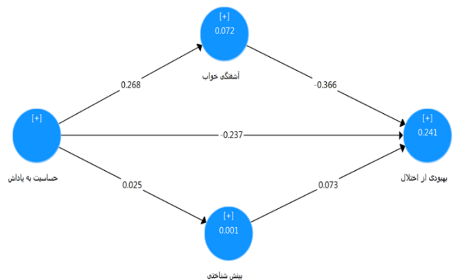
شکل ۱: مدل اصلی در حالت ضرایب مسیر

شکل شماره ۱ مدل اصلی در حالت ضرایب مسیر را نشان می‌دهد. ضریب تعیین برای متغیر بهبودی از اختلال مقدار 0/241 برآورد شده و نشان می‌دهد که متغیرهای حساسیت به پاداش، آشفتگی خواب و بینش شناختی روی هم رفته توانسته‌اند 24\% از تغییرات بهبودی از اختلال را توضیح دهند. با توجه به مقدار ضریب استاندارد و آماره t می‌توان گفت متغیر آشفتگی خواب نسبت به حساسیت به پاداش تاثیر بیشتری بر روی متغیر بهبودی از اختلال داشته‌اند و متغیر بینش شناختی تاثیر معناداری نداشته است. به همین ترتیب، متغیر حساسیت به پاداش تنها 7\% درصد از تغییرات آشفتگی خواب را تبیین می‌کند.