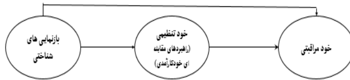
شکل ۱: مدل مفهومی خودمدیریتی بیماری دیابت در نوجوانان: نقش مؤلفه‌های خودتنظیمی و بازنمایی‌های شناختی